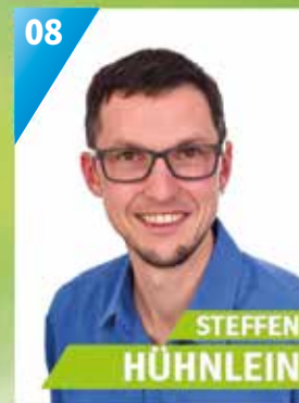
36 Jahre, Schwarzholz b. Rothwind, Religionspädagoge, Gemeinderat, Kommandant Feuerwehr, Kirchenvorstand, Prädikant