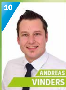
32 Jahre, Willmersreuth, Angestellter Klinikum Kulmbach, Feuerwehr Willmersreuth