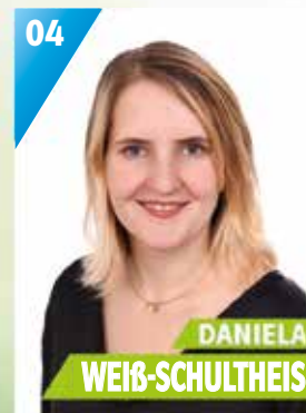
28 Jahre, Rothwind, Kaufmännische Angestellte, Bachelor of Arts in BWL