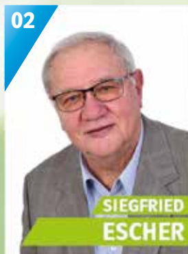
70 Jahre, Pölz, Elektrotechnikermeister, Technisches Hilfswerk, Gemeinderat