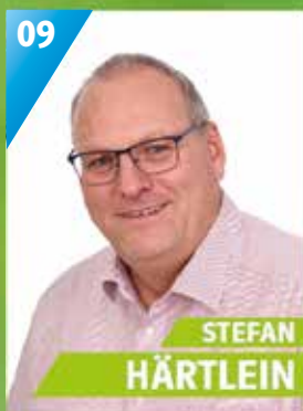
55 Jahre, Schmeilsdorf, Chemielaborant, Beamter Gemeinderat, Kreisbrandrat