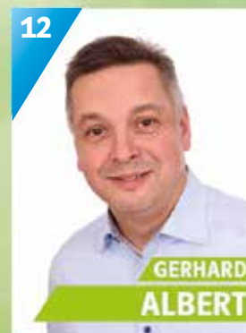
48 Jahre, Mainleus, selbstständig, Vorsitzender Garten- und Blumenfreunde, Lenkungsgruppe

KOMMUNALWAHL IM MARKT MAINLEUS AM 15. MÄRZ 2020