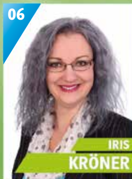
45 Jahre, Schmeilsdorf, Selbst. Mediengestalterin Vorsitzende Parkettfeger