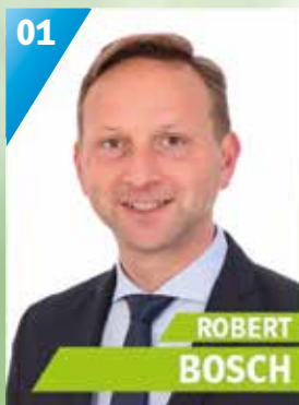
40 Jahre, Mainleus, Bürgermeister Kreisrat