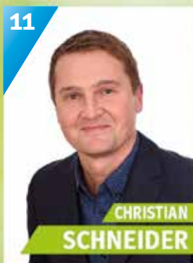
39 Jahre, Mainleus, Vertriebsmitarbeiter und Landwirt, Ortsobmann Bauernverband, Abteilungs- leiter ATS Kulmbach Leichtathletik