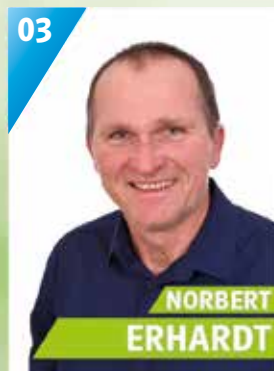
54 Jahre, Motschenbach, Landwirtschaftsmeister Kirchenverwaltung, Jagdvor- stand, Vorsitzender Feuer- wehr, Gemeinderat