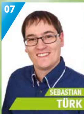
33 Jahre, Mainleus, Geschäftsführer, Gemeinderat