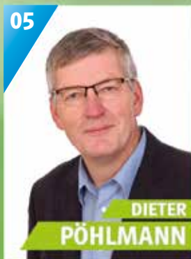
54 Jahre, Mainleus, Lackierermeister, Gemeinderat