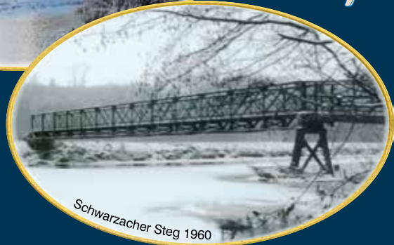
Schwarzacher Steg 1960