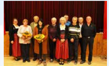
JHV VOM TSV EPFACH