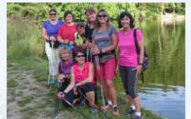
10 JAHRE WALKING-TREFF