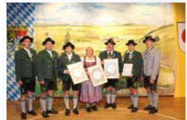
HEIMAT- & TRACHTENVEREIN