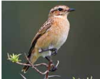
Das Braunkehlchen ist Vogel des Jahres 2023

Wenn die Braunkehlchen im April nach Deutschland kommen, haben sie mehr als 5000 Kilometer hinter sich. Denn sie überwintern im tropischen Afrika und sind daher Langstreckenzieher. Wie viele andere Zugvögel auch, fliegen Braunkehlchen nachts, tagsüber suchen sie nach Nahrung oder ruhen sich aus. Bei uns angekommen, suchen sie blütenreiche Wiesen und Brachen, um hier in Bodennestern zu brüten. Diese verschwinden allerorten, weshalb der Bestand des Braunkehlchens seit Jahrzehnten zurückgeht.