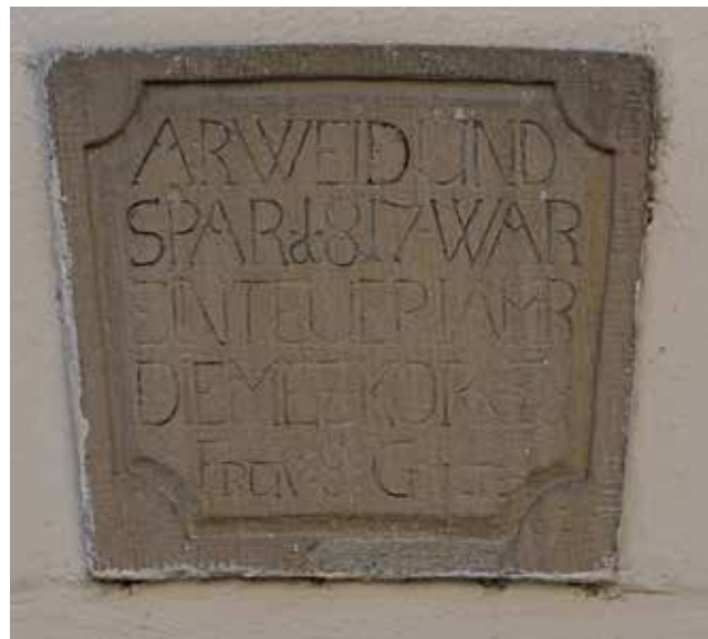
„Arweid und spar 1817 war ein teuer Jahr. Die Mez Korn zu Eren 8 Gulte“

Vor Ort wüteten Tsunamis, der Himmel verdunkelte sich und vom 4300 Meter hohen Vulkan blieben nur noch 2900 Meter übrig. Die Passatwinde trieben die schwarzen Wolken um den Erdball und nach Europa.